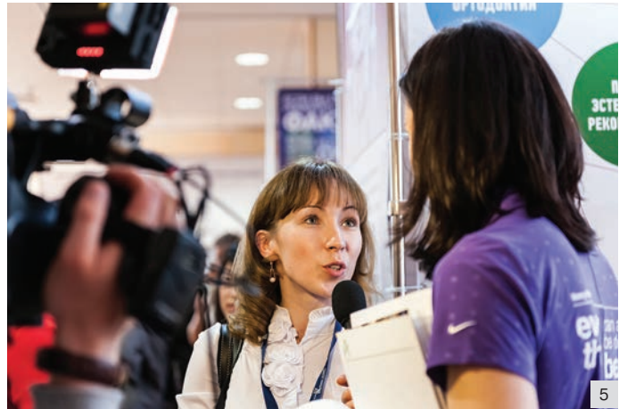
Рис. 5. Симпозиум показал, что российских докторов интересуют актуальные вопросы мировой стоматологии

После круглого стола прошел розыгрыш призов от спонсоров – компаний Myotronics, Augum, Бостонского Института, Luma, Арион, Ivoclar, Bausch, StarSmile и Biomet 3i. Во многом благодаря компаниям-спонсорам, оказавшим поддержку Симпозиуму, стало возможным проведение форума такого уровня.