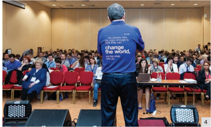
Рис. 4. Начало второго дня научной программы симпозиума

тейль был больше похож на вечеринку у друзей, нежели на официальное мероприятие!