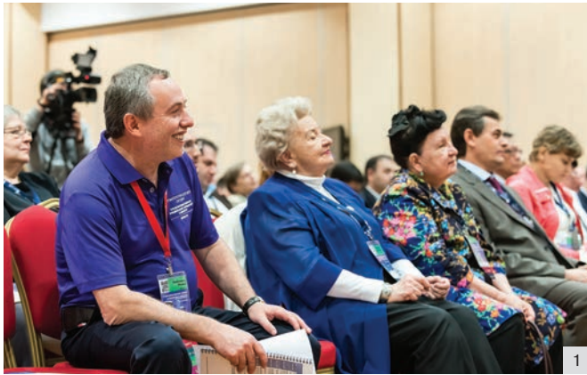
Рис. 1. Аплодисменты в зале симпозиума звучали не только в конце выступлений лекторов, но и по ходу дискуссии